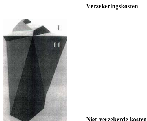
Ijsberg ongevallen de verborgen kosten van ongevallen

Case studies in het Verenigd Koninkrijk wijzen uit dat de verhouding tussen verzekeringskosten en verborgen kosten ongeveer 1:11 is (ijsbergeffect)